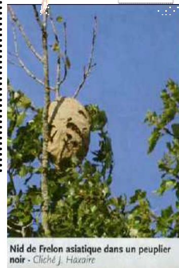
Nid de Frelon asiatique dans un peuplier noir